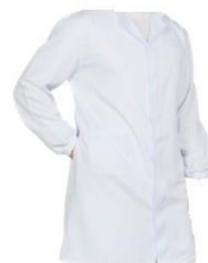
Jaleco manga longa para aulas em laboratório a partir do 6º ano