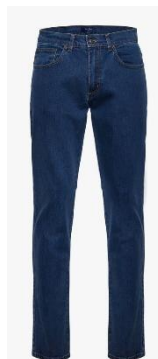
Calça jeans azul marinho sem detalhes a partir do 6º ano