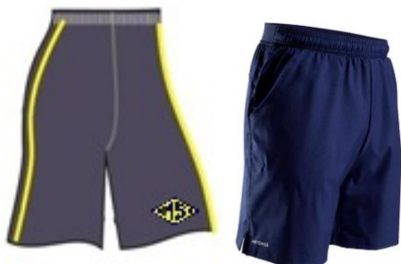
Bermuda para Educação física ou Short sem detalhe