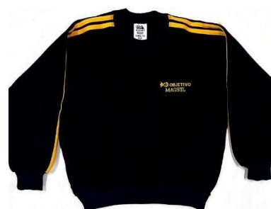
Agasalho de inverno