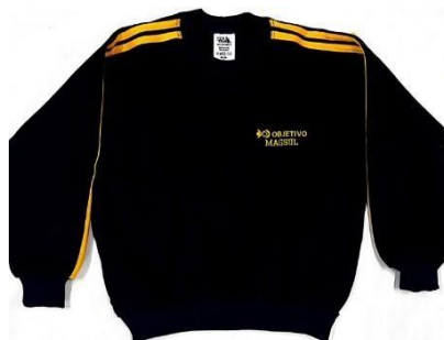
Agasalho de Inverno