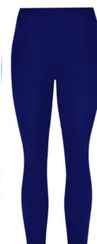
Calça legging azul marinho para educação física