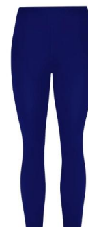
Calça legging azul marinho para Educação física