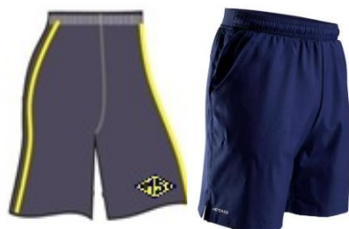
Bermuda para Educação física ou Short sem letalhe