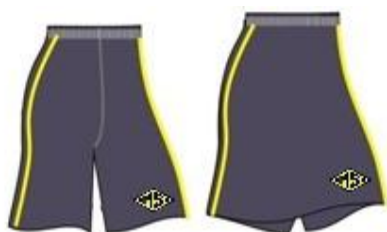
Bermuda masculina Short saia feminino do 1º ao 5º ano